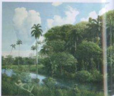
Abaixo, pintura Tons e Tudos . Na página ao lado, abaixo, portrait do artista

ALEJANDRO LLORET www.site.pop.com.br/alejandrolloret lloret@uol.com.br