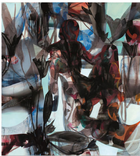
O quadro Crepúsculo