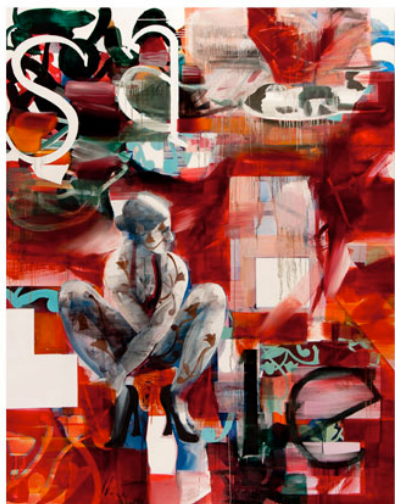
O quadro Templo Profano II

Em 2013 se completam 10 anos da Primavera Negra, época de repressão política especialmente dura em Cuba, que culminou com a prisão de 75 dissidentes, condenados a 20 anos de prisão (em média), por "agir contra a segurança nacional". Primavera Negra é também o título da exposição individual de Alejandro Lloret na Almacén Galeria Gávea , no Rio de Janeiro, em cartaz até 20 de julho.